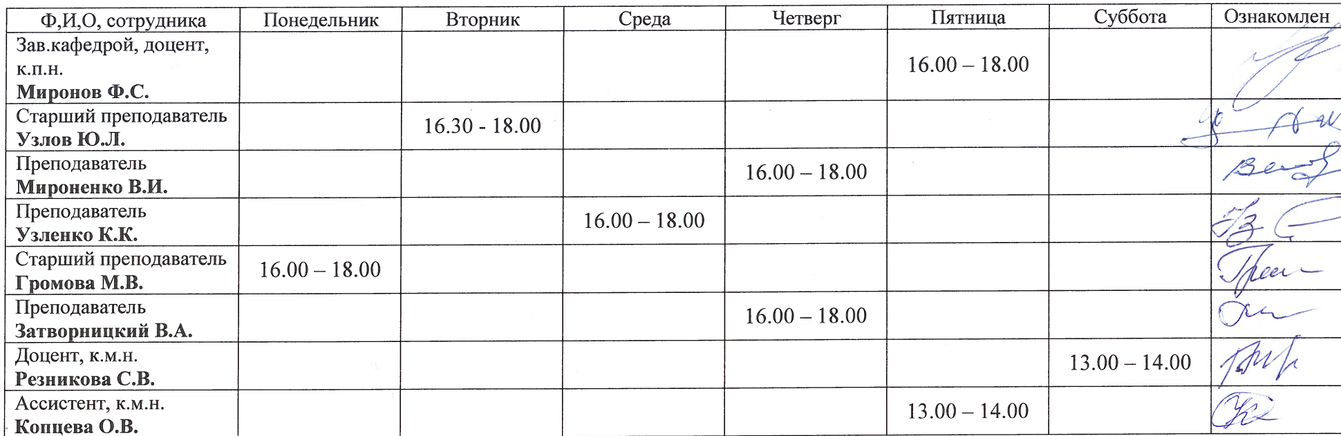
График отработок учебных занятий пропущенных студентами по неуважительным причинам кафедры физической культуры с курсом лечебной физкультуры на весенний семестр 2021-2022 учебного года