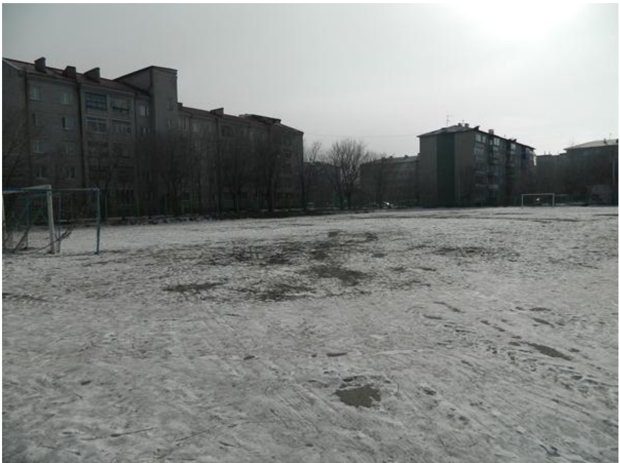
Футбольное поле Амурской ГМА