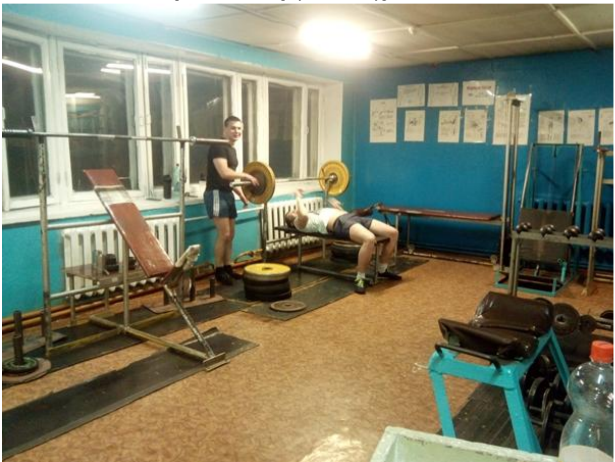
Тренажерный зал корпуса №4 Амурской ГМА