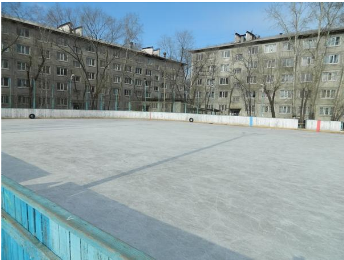
Хоккейная площадка Амурской ГМА