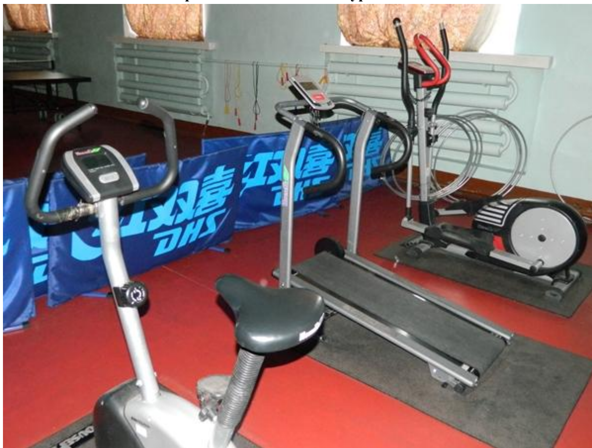
Оснащение спортивного зала главного корпуса Амурской ГМА