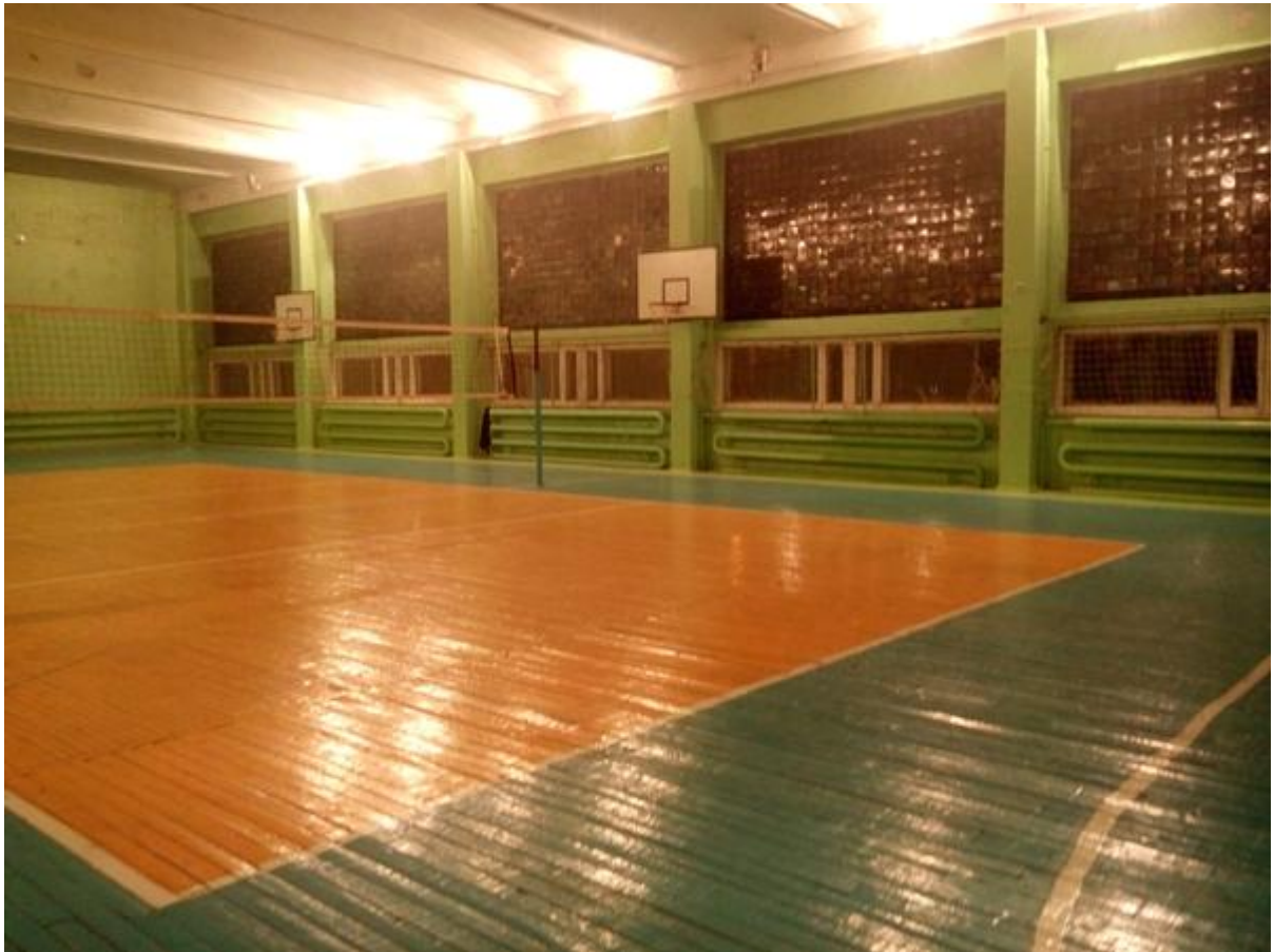
Спортивный зал корпуса №4 Амурской ГМА