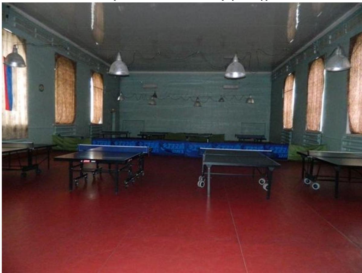
Теннисный комплекс спортивного зала главного корпуса Амурской ГМА