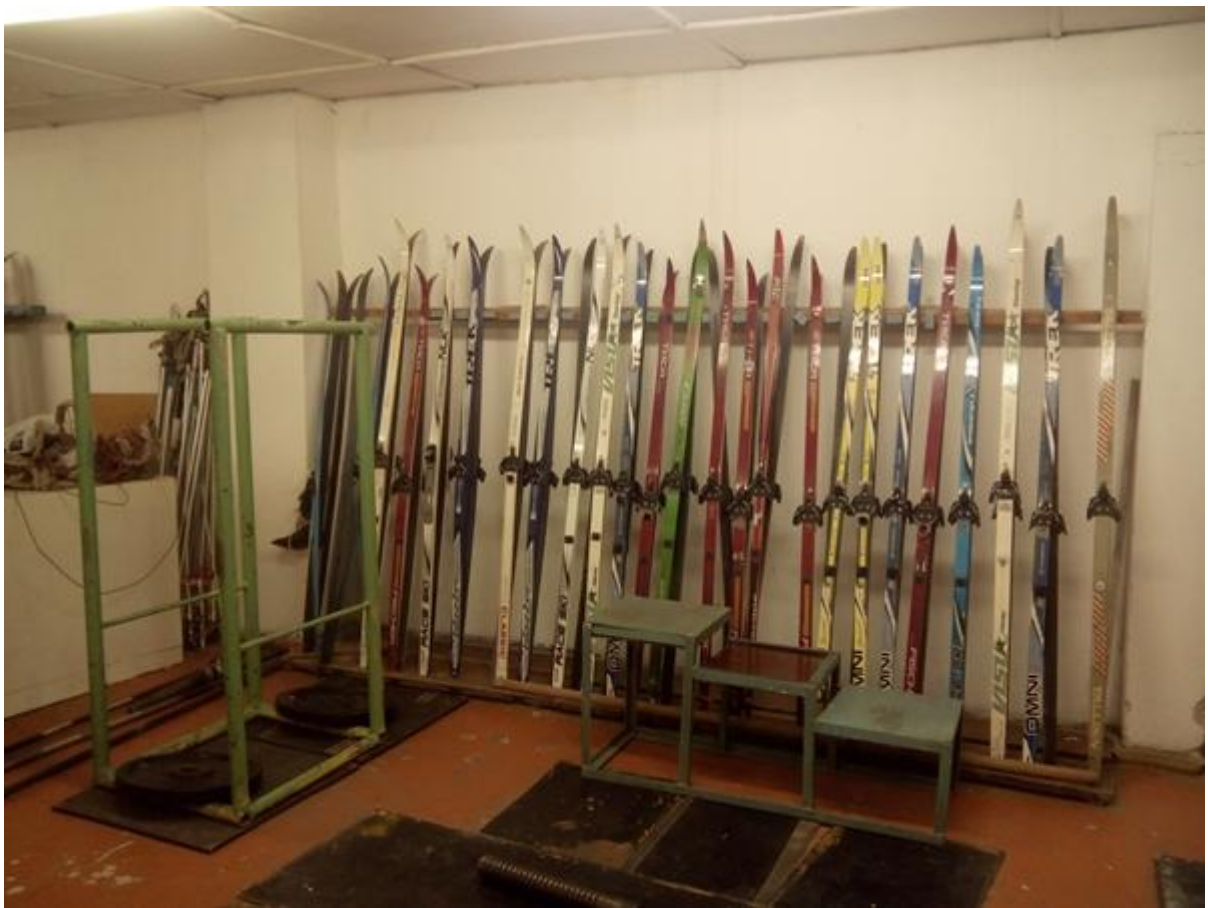
Атрибутика для занятий лыжным спортом